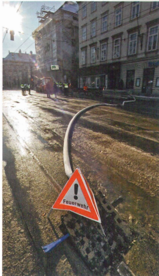
Rohrbruch. In Wien-Alsergrund brach Mitte Juni ein Hauptwasserrohr: Haushalte waren stundenlang ohne Wasser.